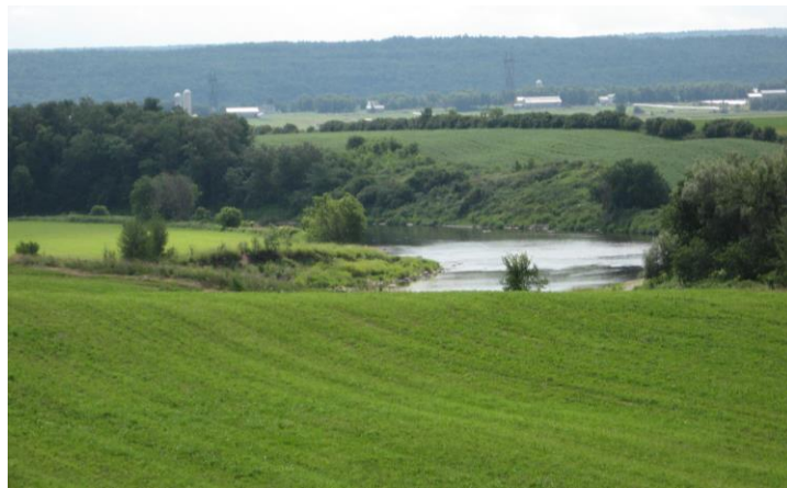
Vue à partir du site de la première église

En effet, après un séjour à Pointe-à-la-Caille, Pierre Blanchet et Marie Fournier se sont établis au nord de la rivière-du-Sud, sur le territoire actuel de la municipalité de Saint-Pierre. Il est difficile de dire quand de façon précise, vraisemblablement à partir de l'année 1696 « qui fut le début d'un mouvement intense de colonisation à la Rivière-du-Sud (Archange Godbout, o.f.m.).