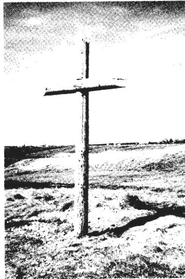
Photo de la croix de la terre ancestrale en 1987